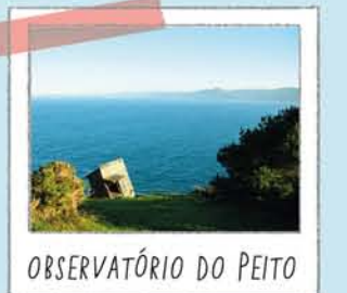
OBSERVATÓRIO DO PEITO

Um remanso no oceano, é um refúgio para a vida marinha. Ao passear pelo seu dique podem ver-se diversos peixes. Para não alterar os seus costumes, não deve alimentá-los nem tomar banho no lago.