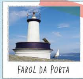
FAROL DA PORTA

Em frente à ilha sul, que nos oferece uma das suas melhores vistas panorâmicas.