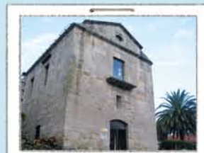
PONTO DE INFORMAÇÃO

Em frente à ilha sul, que nos oferece uma das suas melhores vistas panorâmicas.