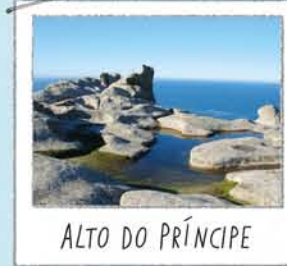
ALTO DO PRÍNCIPE

Uma rocha furada pelo vento e pelo sal. Do observatório mais próximo apreciam-se bonitas vistas do lago e das falésias.