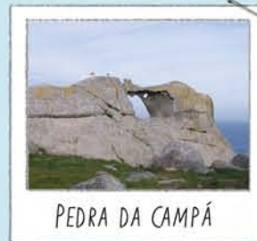
PEDRA DA CAMPÁ

Situado no ponto mais alto visitável. Bom sítio para contemplar a falésia e o voo das gaivotas que ali procriam. Para não alterar as aves, não se aproxime nem as alimente.