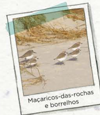
Maçaricos-das-rochas e borrelhos

AS PRAIAS encontram-se na costa mais tranquila, onde o mar deposita as areias. Estas areias são retidas pelas plantas da duna, evitando assim a erosão da praia.