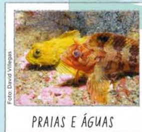
PRAIAS E ÁGUAS