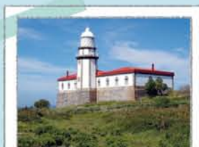
FAROL DE ONS

No ponto mais alto da ilha, é um dos últimos faróis habitados por faroleiros. O seu interior não é visitável.