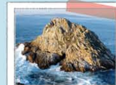
PONTA DO CENTOLO