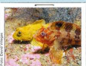
PRAIAS E ÁGUAS

Nas rochas mais próximas das praias vê-se uma grande variedade de vida marinha. Descubra-a com uns óculos de mergulho. Desfrute dela sem lhe tocar. Para usar cinto de mergulho é necessário autorização.