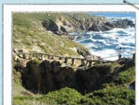
BURACO DO INFERNO

Greta na falésia que enfrenta os temporais marinhos do sul, que alargaram e aprofundaram a furna até furar o seu teto, criando assim um grande burac à superfície.