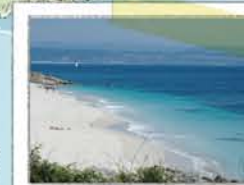
PRAIA DE MELIDE

De tradição nudista, onde se pode tomar banho, ver a fauna marinha e a flora dunar (sem pisar).