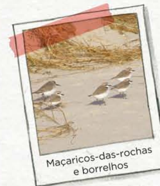
Maçaricos-das-rochas e borrelhos

AS PRAIAS encontram-se na costa mais tranquila, onde o mar deposita as areias. Estas areias são retidas pelas plantas da duna, evitando assim a erosão da praia.