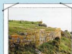
PONTA DO CASTELO

Na antiga escola, acolhe agora uma exposição sobre a história e os costumes dos habitantes de Ons. Consulte horários.